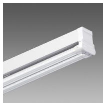
6502 Rapid system - bilampada LED