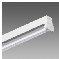
6402 Rapid system - monolampada LED