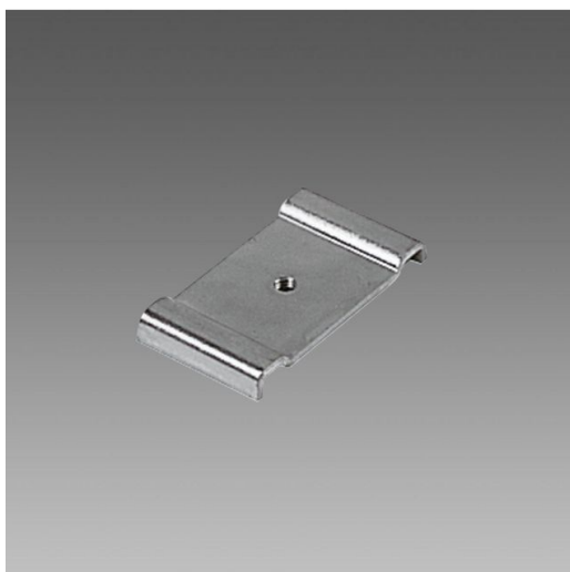
6036 Attacco universale