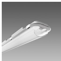
971 Ottima - High Performance