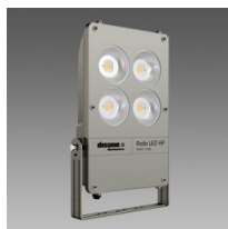
1897 Rodio HP - COB simmetrico