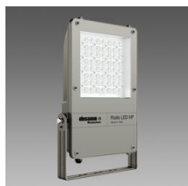
1888 Rodio LED HP - simmetrico fascio stretto