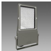
1224 Cromo - asimmetrico fascio stretto