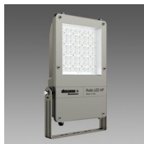
1887 Rodio LED HP - asimmetrico