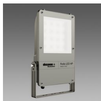
1890 Rodio LED HP - simmetrico fascio largo