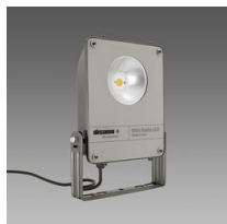
1999 Mini Rodio - COB simmetrico