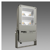
1898 Rodio HP - COB asimmetrico