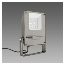
1988 Mini Rodio - simmetrico fascio stretto