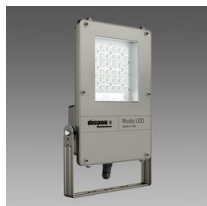
1892 Rodio LED - ottica stradale