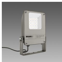
1990 Mini Rodio - simmetrico fascio largo