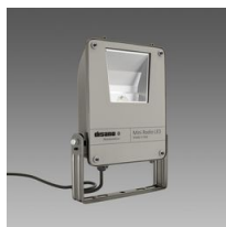
1998 Mini Rodio - COB asimmetrico